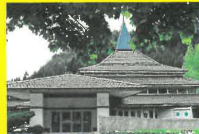
Le Terme di Arta