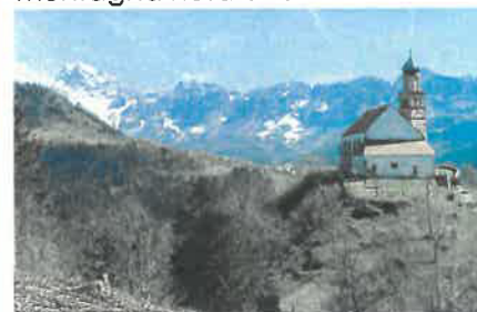
La Pieve di San Pietro

Nel cuore della Carnia, Iulium Carnicum , l'odierna Zuglio , è la città romana più a Nord d'Italia. Conserva ancora oggi i resti del suo Foro Romano . Dall'alto è dominata dall'antica e prestigiosa Pieve di San Pietro . Nelle immediate vicinanze vi sono le Terme di Arta e lo Zoncolan , la montagna nota a tutti i ciclisti.