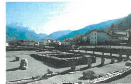
Il Foro Romano di Zuglio

INFO: www.carniabike.it mail: info@carniabike.it